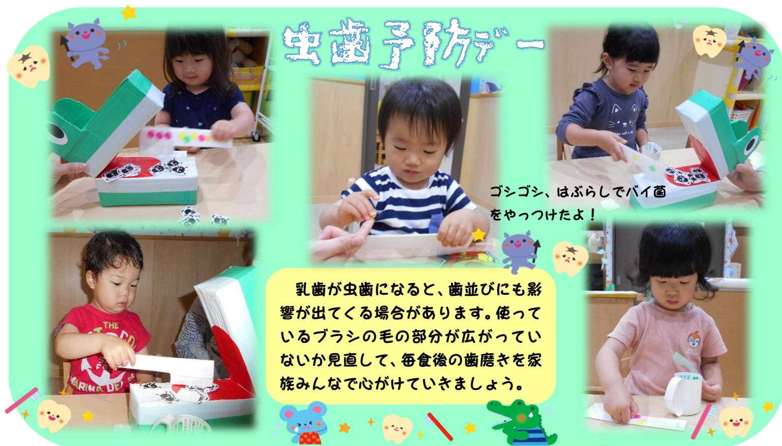
ゴシゴシ、はぶらしてバイ菌をやっつけたよ!

乳歯が虫歯になると、歯並びにも影響が出てくる場合があります。使っているブラシの毛の部分広がっていないか見直して、毎食後の歯磨きを家族みんなで心がけていきましょう。