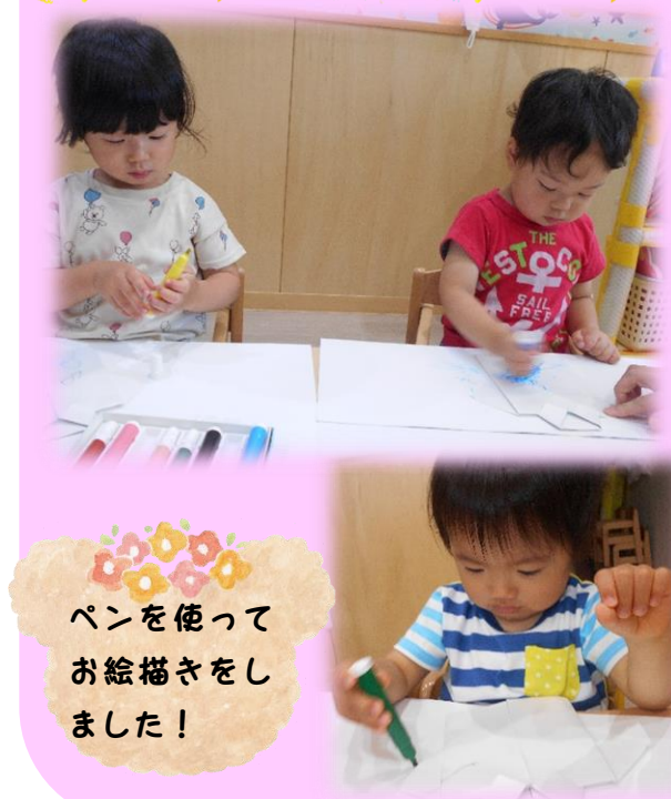
ペンを使ってお絵描きをしました!