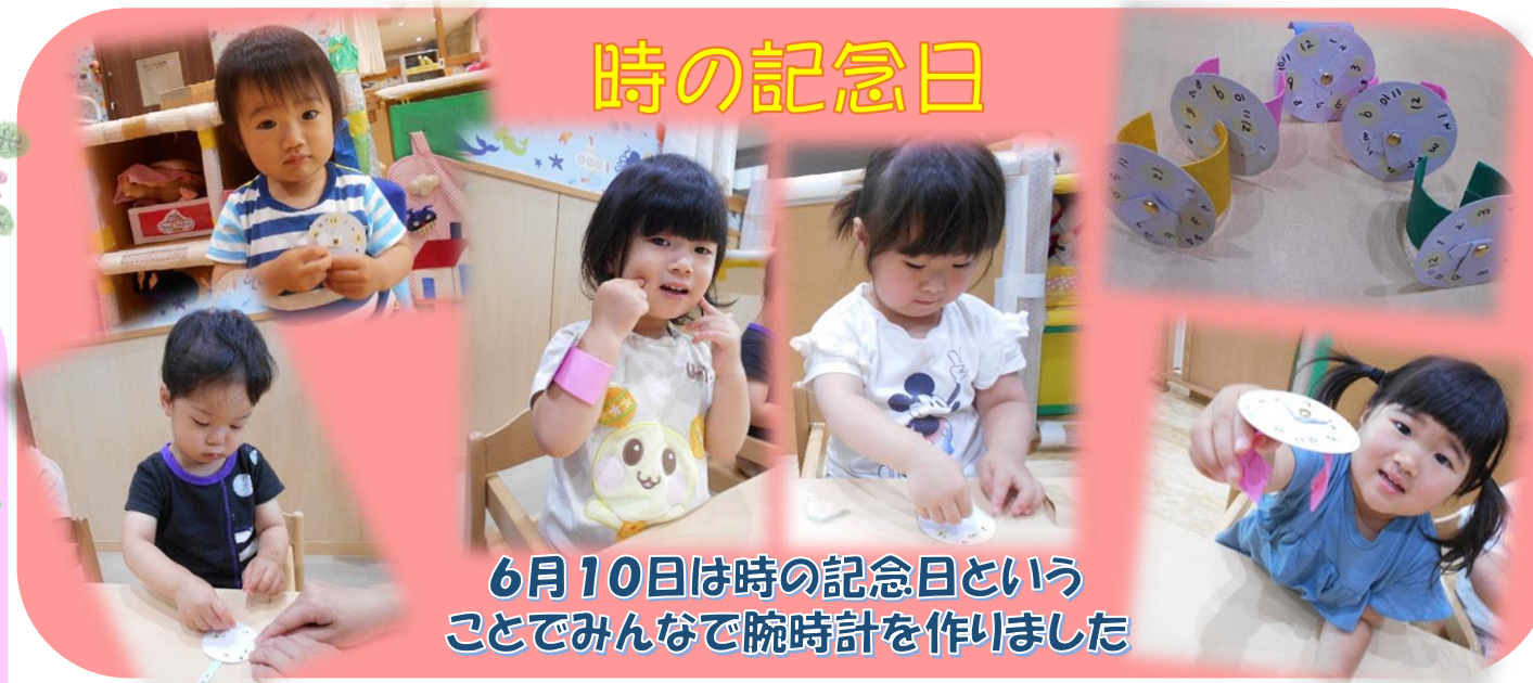
6月10日は時の記念日ということでみんなで腕時計を作りました