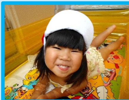
ワニさん歩きがとっても上手！