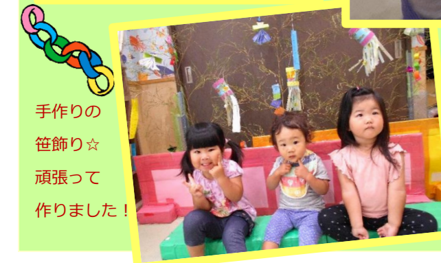
手作りの 笹飾り☆ 頑張って 作りました！