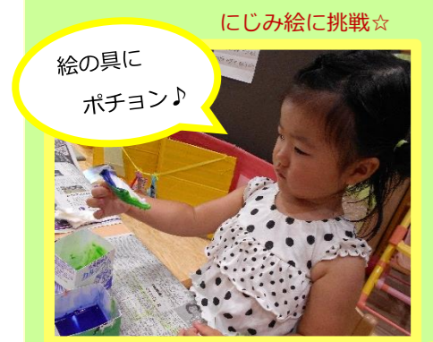
絵の具に ポチヨン♪

7月7日(水)七夕会を行いました。お星さまのお話を聞いたり、歌を歌って楽しみました。お星さまゲームもしたよ！楽しかったね♪