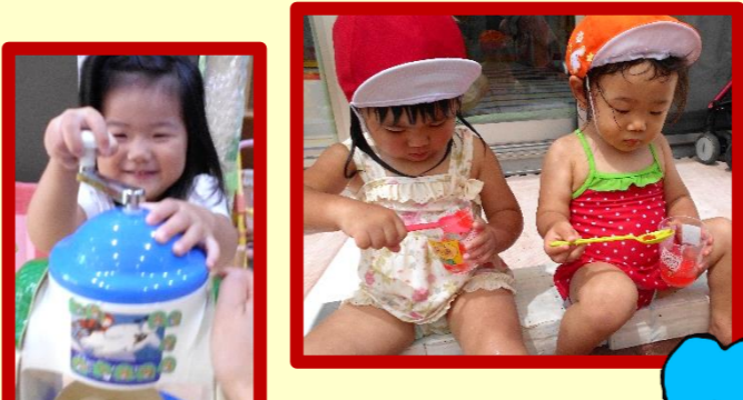
暑い日にはかき氷のおやつをいただきました！