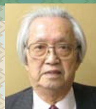
ともいき家族会 会長