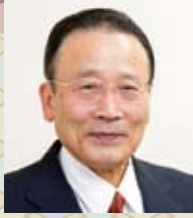
社会福祉法人 ともいき福祉会 理事長