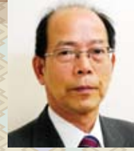
特別養護老人ホーム ぬく森 施設長